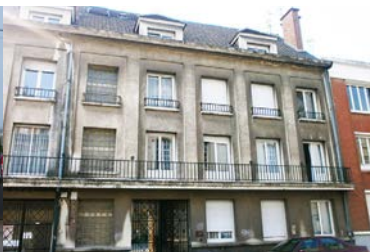
Unité de vie Morel